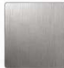
ACERO INOX SATINADO