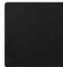
LAMINADO NEGRO MATE