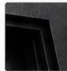
MARCO ACERO NEGRO TEXTURIZADO